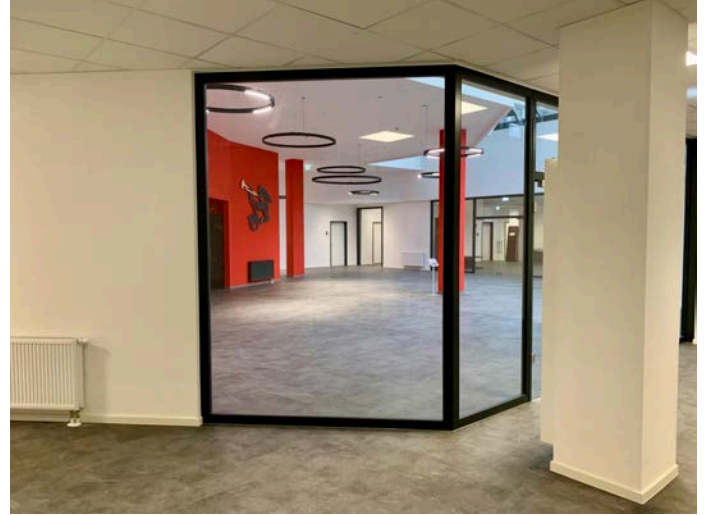
Ausgang - Blick zum Bistro